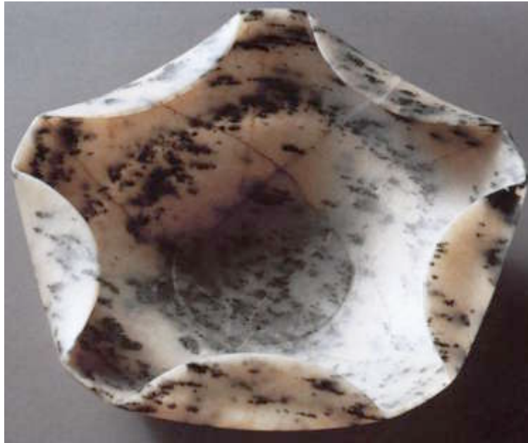
Figure 2: coupe n°99 en gneiss anorthositique, Catalogue de l'exposition, l'Art Égyptien au Temps des Pyramides, Réunion des Musées Nationaux, 1999.

l'artisan aurait travaillé avec une extrême lenteur et minutie, en usant cette matière particulièrement dure, millimètre par millimètre, pendant une vie entière. À l'évidence, l'artisan avait employé une technique proche du façonnage de l'argile, substituant la céramique par une pâte de pierre élaborée grâce à la chimie et travaillée comme l'argile. De quoi laisser songeur.