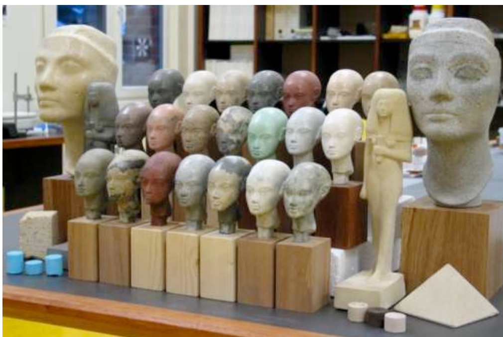
Figure 1: Exemples de moulages en pierres géopolymère (calcaire, granit, grès, arkose, ...) (2003)

Oui et non. Ces pierres de synthèse sont en fait des matériaux ré-agglomérés. Le procédé est expliqué plus en détail dans le livre. Le principe est, en gros, le suivant : on part d'une matière minérale, d'une roche érodée, délitée, naturellement désagrégée – par exemple le calcaire comme celui qui affleure un peu partout dans le Nord de la France – et on va lui redonner une structure compacte grâce à un liant, une colle géologique qui va agglomérer (ou ré-agglomérer) entre elles les particules minérales. Le résultat final est celui d'une roche qui semble parfaitement naturelle : dans notre cas, par exemple, un calcaire extrêmement solide comme peuvent l'être certains calcaires. Le géologue n'y verra que du feu. Seule une observation très fine du liant peut révéler la nature synthétique de la roche puisque nos particules sont incontestablement du calcaire, du granit ou ce que vous voulez.