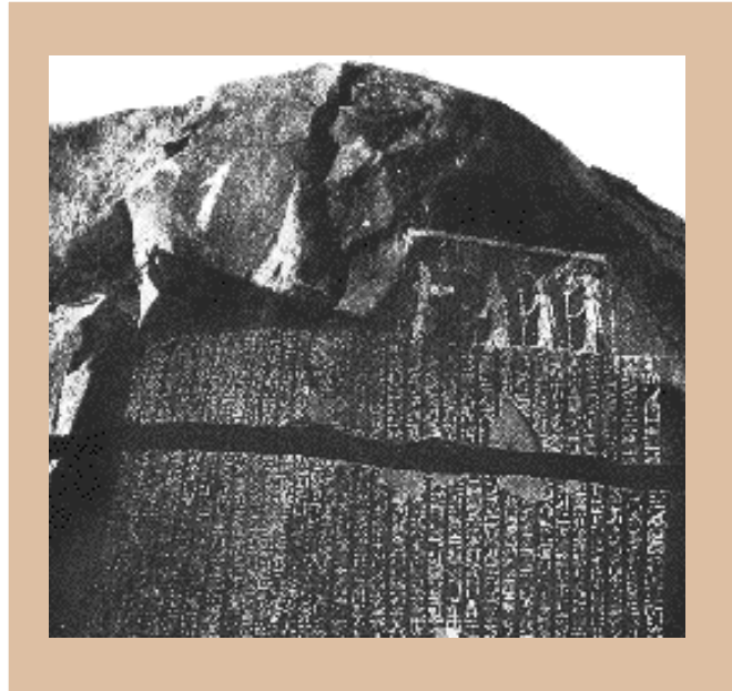
The Famine Stele , island of Sehel, Elephantine, Egypt. 32 columns of hieroglyphic text (read from right to left).

Presented at the Vth International Congress of Egyptology, Cairo, Egypt, Oct. 1988.